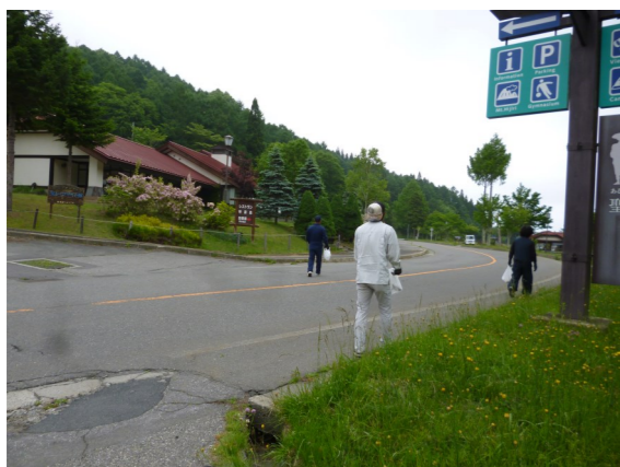
二手に分かれて作業開始！

青年部では、六月十日の「商工会の日」の前後に、麻績村の観光地である聖湖周辺のゴミ拾いを行っています。 「絆」感謝運動とは、全国の商工会青年部の統一事業であり、それぞれの地域において地域貢献の事業を実施することとなっています。 本事業は、東日本大震災をはじめ、各地で発生する災害時の復興支援活動等でも、改めて確認された青年部及び地