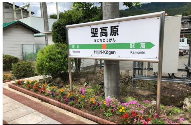
見違えるほど、綺麗になりました。

今年は、花壇手前にプロックを置くことで、花壇らしさを出し、多くの花を植えました。