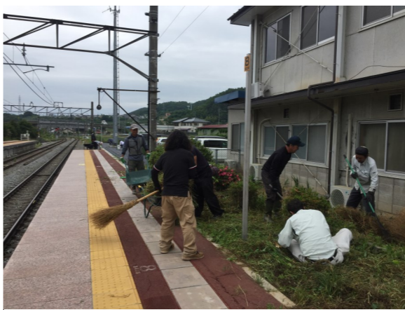
手分けして、一斉に作業します。

麻績村の玄関口であるJR聖高原駅を綺麗にすることで、観光客だけでなく、JRを利用される皆様にも気持ちよく利用していただきたという思いで、作業をしました。