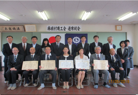
表彰された皆様と御来賓