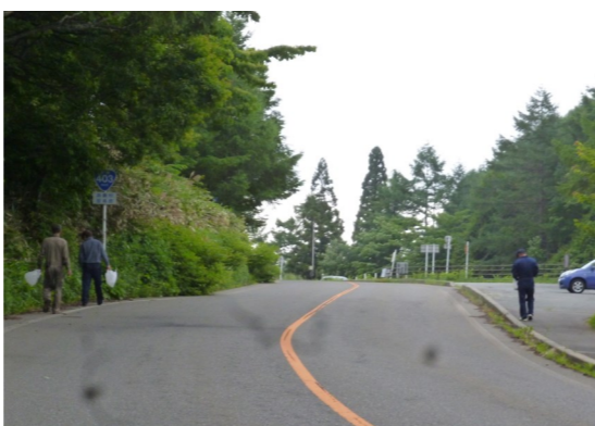
聖湖周辺を部員皆で綺麗にします。

域における「絆」について再認識・感謝するとともに、今後さらなる結びつきを地域単位で強化していくこと等を目的に実施します。 今年度の活動としては、六月九日に、商工会本会の事業として聖高原駅構内の美化活動に参加させていただき、その後青年部員とともに聖湖周辺から航空博物館周辺の清掃活動として、ゴミ拾いを行いました。一時間程度の活動でしたが、目立ったゴミもなく、綺麗な環境が保たれていました。